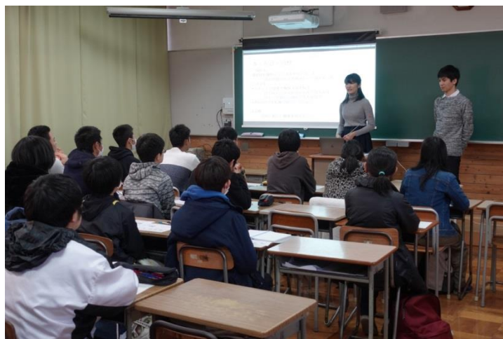
写真2 総研大生による高校生向け授業の様子。生徒達は年齢が近いので、親しみをもって話を聴けたようです。