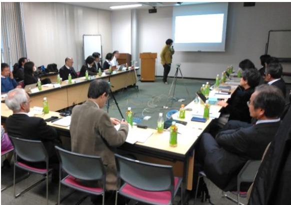
当日のアジェンダ

それらを踏まえ、各専攻より、教育研究内容の発表がなされ、互いの教育内容を紹介・共有しました。専攻においては、専門教育のみならず、幅広い視野を育成する教育を実施している専攻もかなり多いことがわかりました。また、研究指導体制においても、担当教員だけではなく、複数の教員による、いわゆる集団指導体制をとっている専攻も多くみられました。その他も含め、紹介内容に基づき、全員でのディスカッションを行い、日本の最先端研究機関における人材育成のあり方について、総研大独自の人材とはどのような人材か、今後、大学がどのような方向に進むべきかを議論しました。忌憚のない率直な意見交換が行われ、和気あいあいとした雰囲気の中、成功裏に終了しました。【企画室・特任准教授 西中美和】