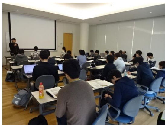
ガイダンスの様子