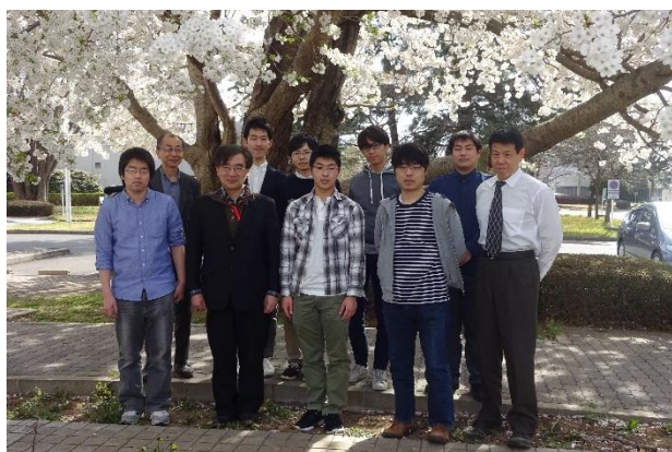
KEKつくばキャンパスでの集合写真

ガイダンス終了後の歓迎会では新入生の自己紹介が行われ、それぞれの意気込みが語られました。また、大学院生や研究員だけでなく教員らも多数集まり、学生生活や研究内容について議論に花を咲かせました。【高エネルギー加速器科学研究科】