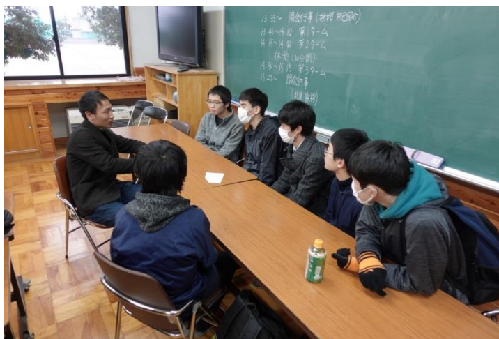
写真1 真剣な表情で総研大生に話を聞く高校生達。交流会での一コマ。

29日午後には、院生2名がペアとなり、3グループに分かれて授業を実施しました。受講登録した高校生は81名。他にも飯田高校の先生方も含めて飛び入り参加した生徒もいました。きついリハーサルを重ねた甲斐があって、総研大生は、高度な内容を非常に分かりやすくかみ砕き、立派な授業を行いま