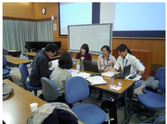
グループ討論の様子

総研大物理科学研究科天文科学専攻により、総研大アジア冬の学校「SOKENDAI-UST Asia Winter School 2019（以下 SAWS2019）"Star and Planet Formation: Key Questions and Challenges"」が 2019 年 2 月 27 日から 3 月 1 日に国立天文台三鷹キャンパスにおいて開催されました。今年度は韓国の UST (University of Science & Technology) との共催により、日本国内からの参加者 21 名に加えて、韓国から 9 名、その他台湾、インドネシア、タイ、ベトナムなどアジア各国から計 42 名の学部生、大学院生、若手研究者の参加がありました。